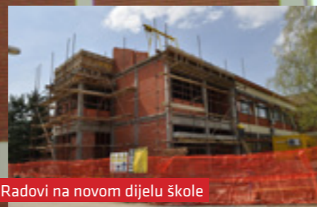
Radovi na novom dijelu škole

Divimo se svim profesorima koji su izdržali kraj protekle školske godine! Podsjetimo, uz bušenje i zidanje majstora, dežurstva na državnoj maturi, održavanja redovne nastave i preseljenja iz male zbornice u još manju, tj. knjižnicu, oni su opet tu s nama, svježi: ah, ljeto, bilo je to davno! Osvanula je nova školska godina i napokon smo uselili u svoje nove četiri učionice. Nastala je