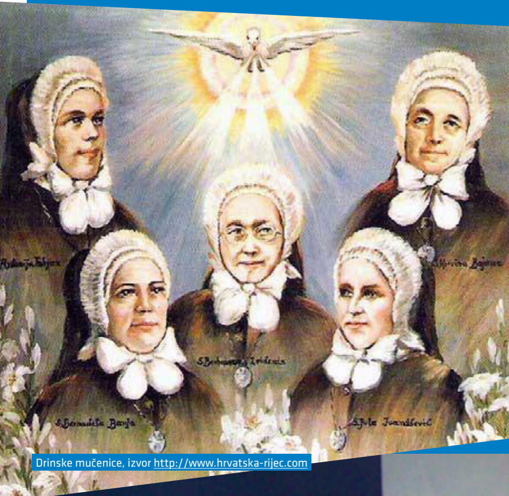
Drinske mučenice