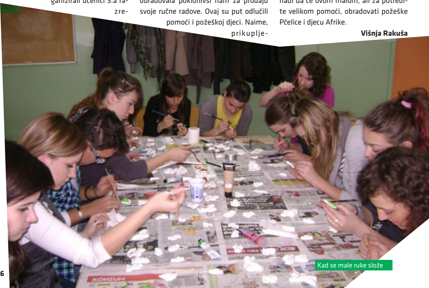
Kad se male ruke slože