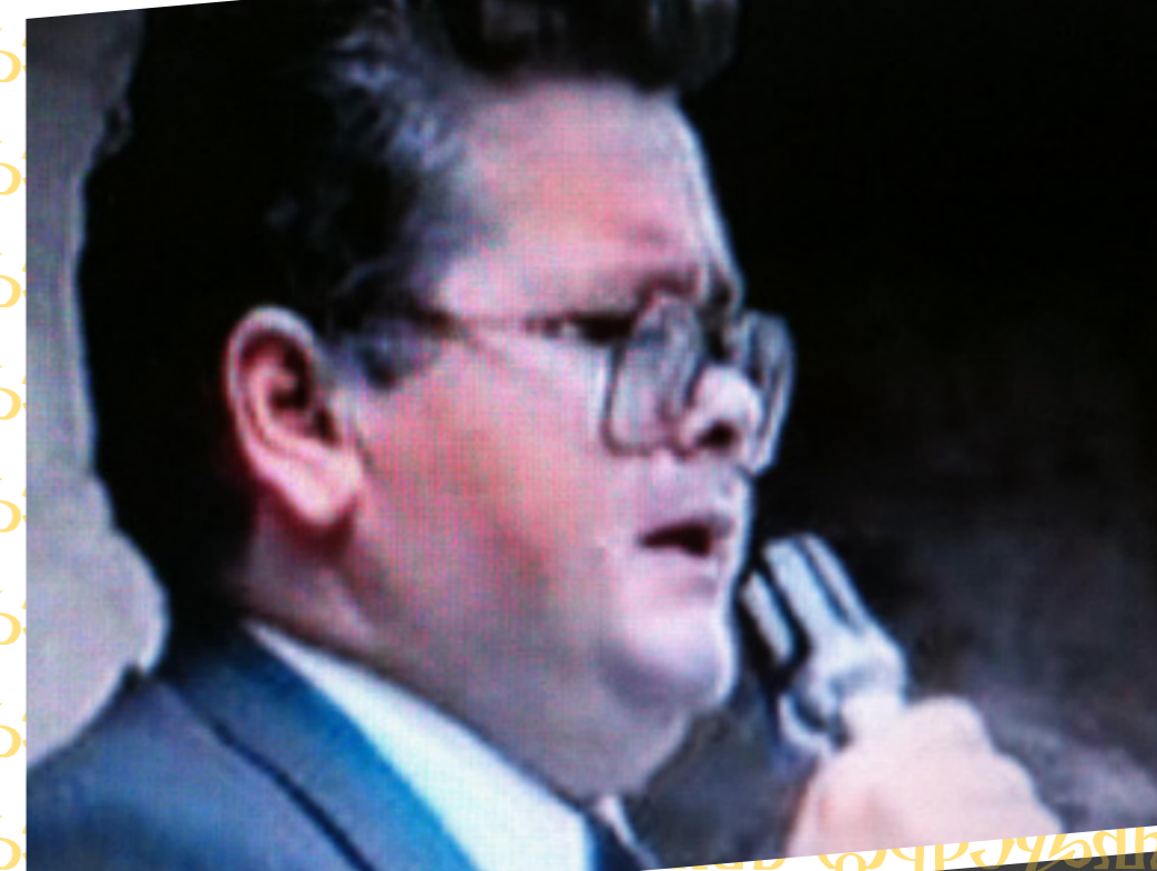
Ivan Šreter