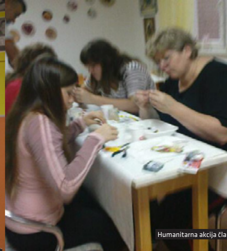
Humanitarna akcija članova udruge