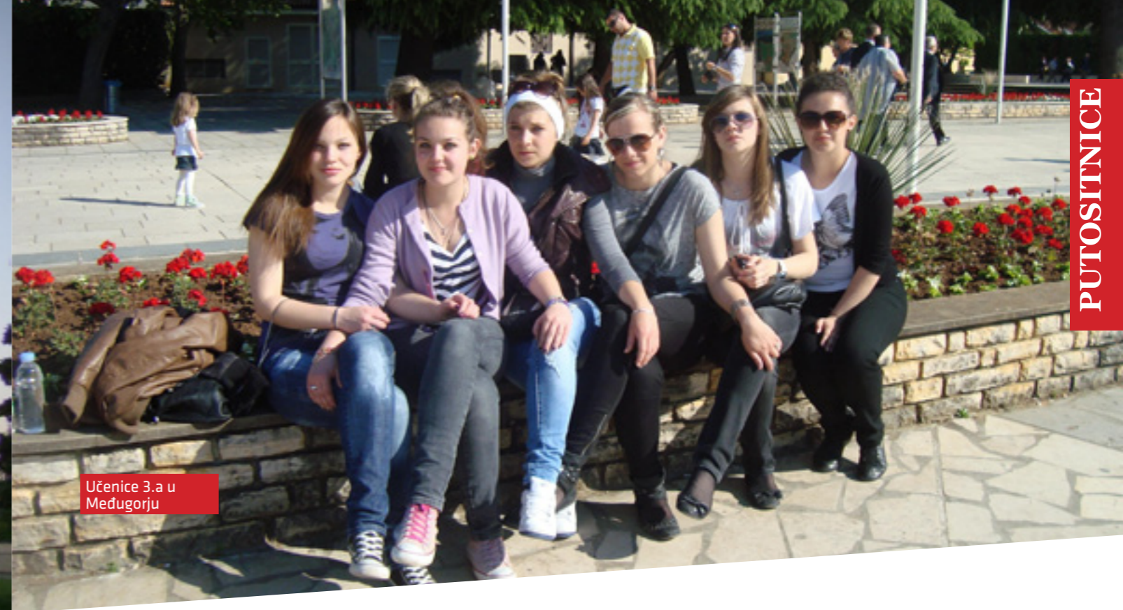
Učenice 3.a u Međugorju

uzbrdo, sigurna sam, svi smo jedva čekali da se popnemo. Bilo nam je naporan tako hodati po ogromnom kamenju. Ali kada smo se popeli gore, kada sam vidjela križ i krajolik, drugačije sam se osjećala. Tada sam vidjela što nam je Bog dao. Prekrasan krajolik koji se vidi odozgo ne može se opisati riječima. Osjećala sam se kao u raju. Preplavio me neopisiv osjećaj radosti, mira, sreće, ljubavi, topline, milosti, blaženstva. Nakon Križevca posjetili smo Podbrdo ili Brdo ukazanja. Na samom mjestu ukazanja postavljen je kip Kraljice Mira, susret s Brdom ukazanja za