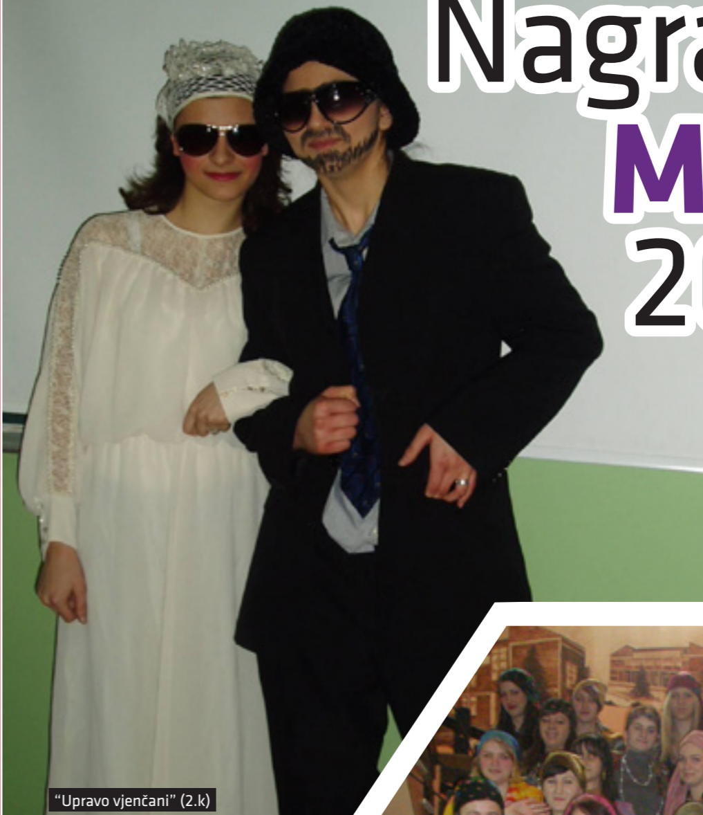
"Upravo vjenčani" (2.k)