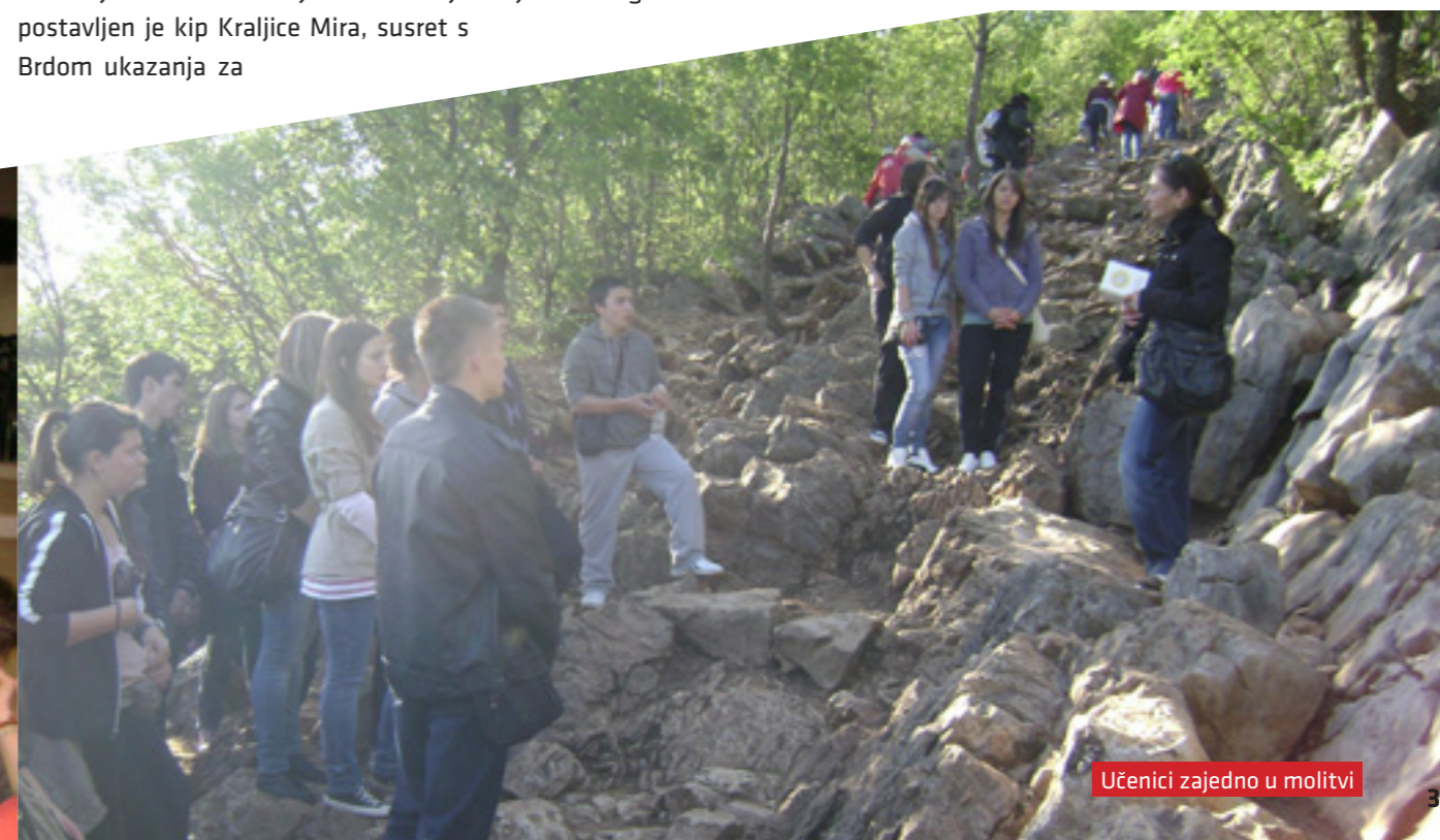
Učenici zajedno u molitvi