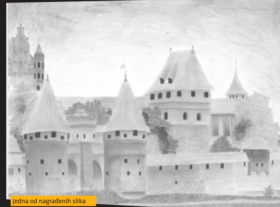
Jedna od nagrađenih slika