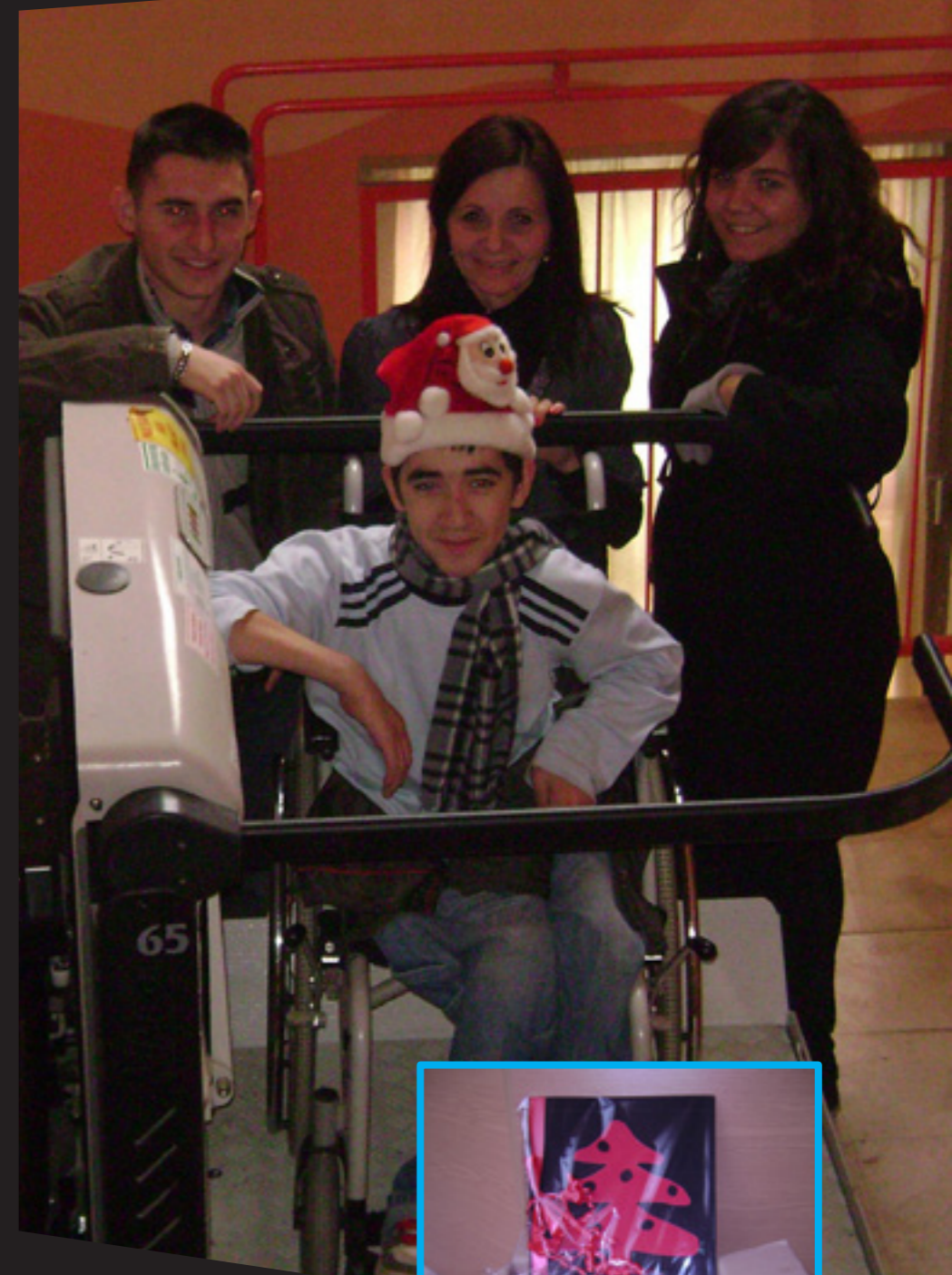
Pokloni za djecu bez roditeljske skrbi u Dubecu