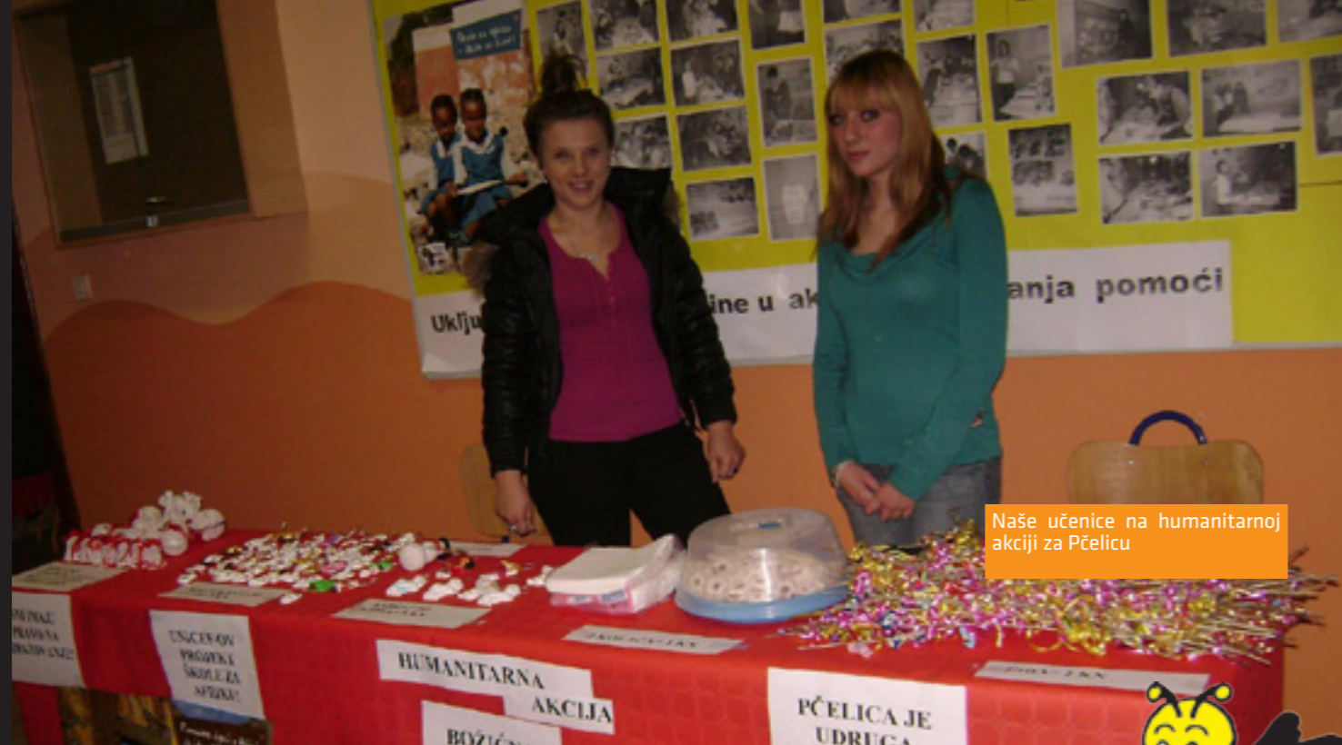
Naše učenice na humanitarnoj akciji za Pčelicu