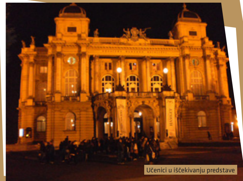
Učenici u iščekivanju predstave