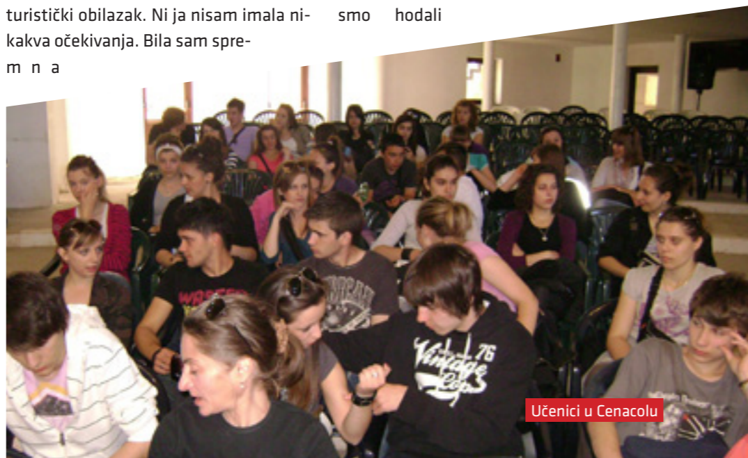
Učenici u Cenacolu

na to da ću po povratku zaključiti da je to sve samo hrpa kamenja i ništa više, ali da će se dogoditi nekakvo nadnaravno iskustvo, nisam očekivala. Pred sam dolazak u Međugorje, osjetila sam nekakvu uzvišenost što dolazim na mjesto gdje se ukazuje Isusova Majka. Prvo smo posjetili Križevac, brdo iznad Međugorja, na kojem su župljani još 15. ožujka 1934. godine podigli 8,56 m visok križ, a sam posjet brdu za hodočasnike znači poziv da susretnu Isusa u njegovoj muc i otkriju njegovu ljubav. Kada sam ugledala brdo činilo mi se previsoko. Kamenita staza kojom smo hodali za mene je doista postala prikaz Isusove muke. Dok smo hodali