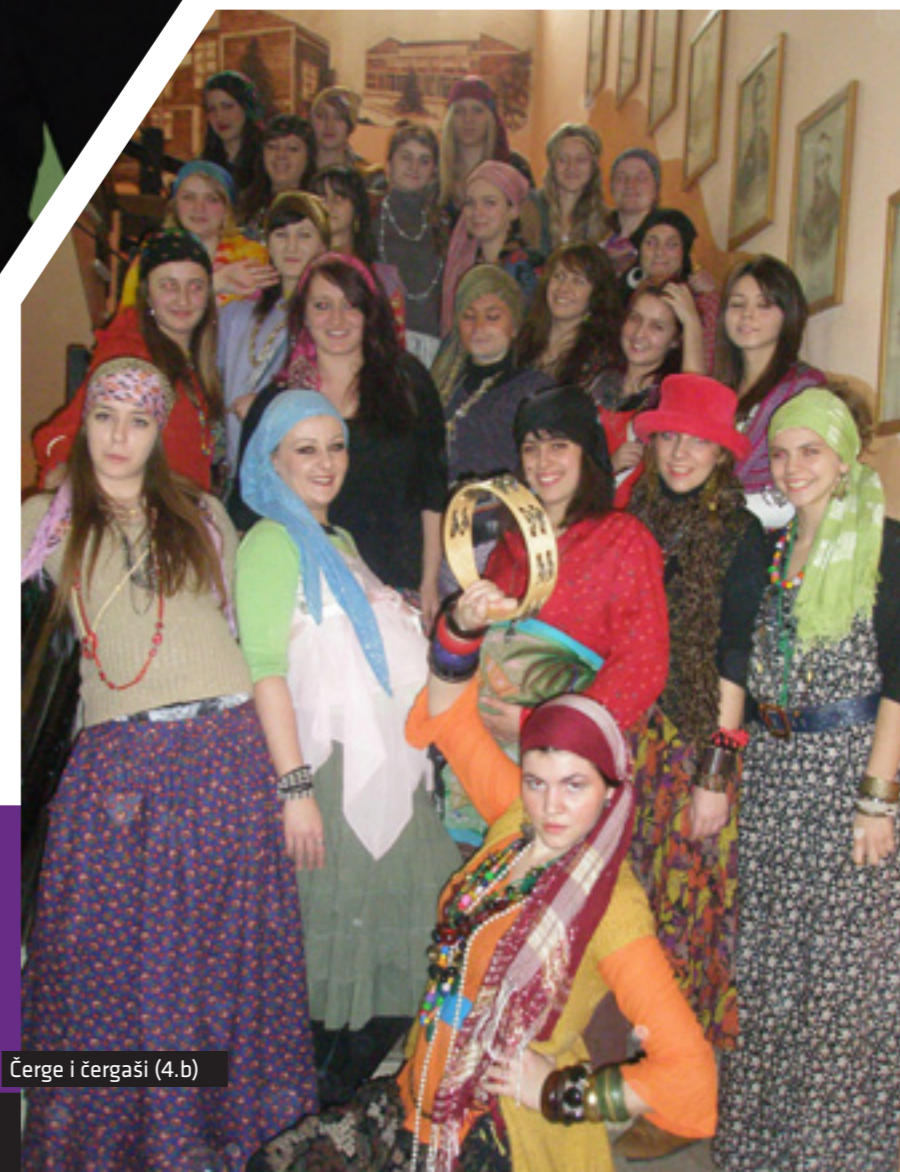
Čerge i čergaši (4.b)